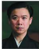
観世流能役者 味方玄 みかた けんじ

一九六四年片山幽雪(九世片山九郎右衛門)の長男として京都に生まれる。姉は京舞井上流五世家元井上八千代。父及び八世観世鍔之亟に師事。二〇一一年十世片山九郎右衛門を襲名。片山定期能楽会を主宰。国内・海外を問わず多数の公演に出演。能楽の普及活動として学校公演や「能の絵本」の制作も手掛ける。重要無形文化財総合指定保持者。文化庁芸術祭新人賞、日本伝統文化振興財団賞、京都府文化賞功労賞、芸術選奨文部科学大臣新人賞など受賞多数。公益社団法人京都観世会会長、公益財団法人片山家能楽・京舞保存財団理事長。